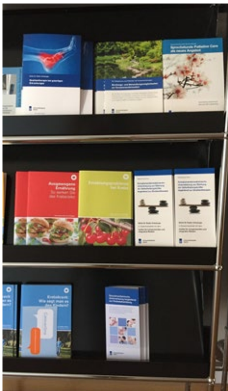
Komplementärmedizinisches Angebot in der Klinik für Radio-Onkologie am Universitätsspital Zürich.

reiten. Eine Atemtherapeutin bietet an, see-lische Blockaden mit Energieübertragungen zu lösen. Die Beziehung zu ihr wurde von einer Patientin als «energetisch, in kosmische Zusammenhänge eingebunden» beschrieben. Die Therapie selbst nahm sie als Unterstützung ihrer spirituellen Vorbereitung auf den Tod wahr.