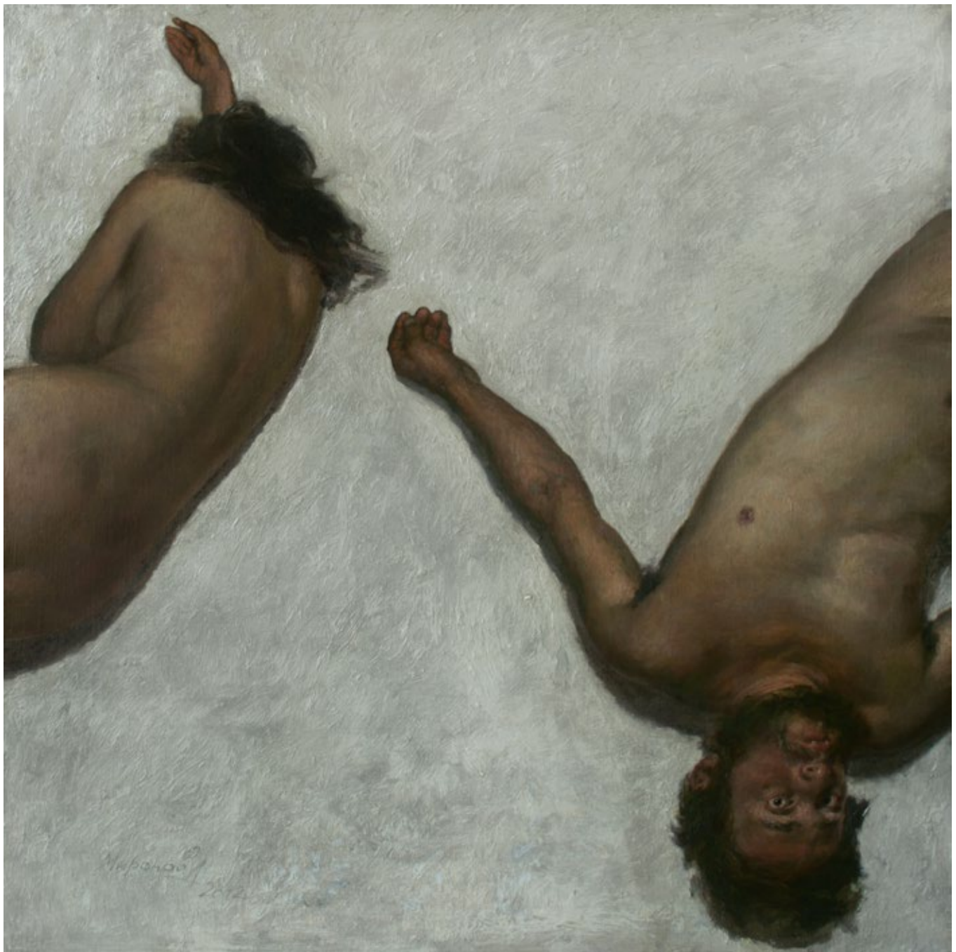
Adam und Eva. Der Sündenfall. 2012. Öl auf Leinwand. Andrey Mironow.

satten, zufriedenen, sich selbst ereignenden Sterben widerspricht der Realität heutiger Selbst- und Fremderfahrungen von Krankheit, Siechtum, Sterben und Tod» (Frank Mathwig).