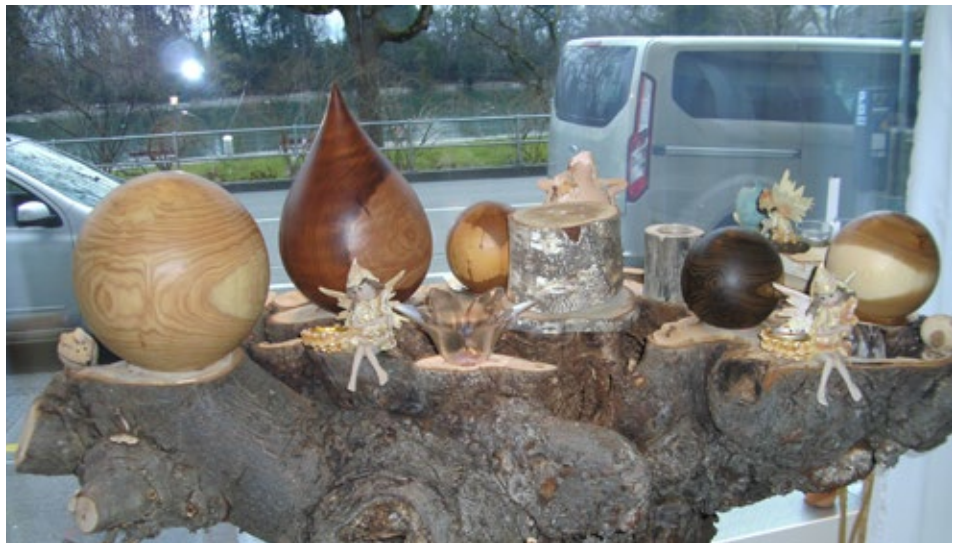
Hölzerne Urnen in einem Schaufenster.

Auch wenn sich die Mehrheit heute noch immer für gemeinschaftsgebundene religiöse Bestattungen entscheidet, so steigt die Zahl von Ritualen, die ausserhalb einer religiösen Gemeinschaft von freien Ritualleitenden durchgeführt werden. 22 Prozent der Schweizerinnen und Schweizer bezeichnen sich als keiner Religion zugehörig. Veränderungen von Todesritualen zeigen sich darin, dass die Angehörigen von den Ritualleitenden dazu ermuntert werden, ganz bewusst die Totenfürsorge selbst zu übernehmen, den Sarg zu bemalen, das Bestattungsritual selbst zu gestalten. Zudem finden sich vermehrt Gedenk- und Erinnerungsfeste, die Neuinterpretationen von religiösen Festen sind und sowohl individuelle als auch kollektive Elemente aufweisen.